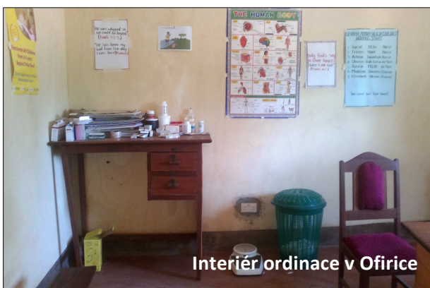
Interiér ordinace v Ofirice