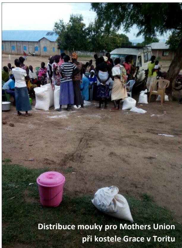
Distribuce mouky pro Mothers Union při kostele Grace v Toritu