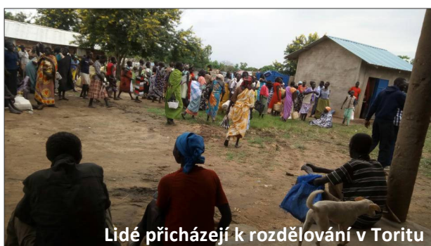
Lidé přicházejí k rozdělování v Toritu