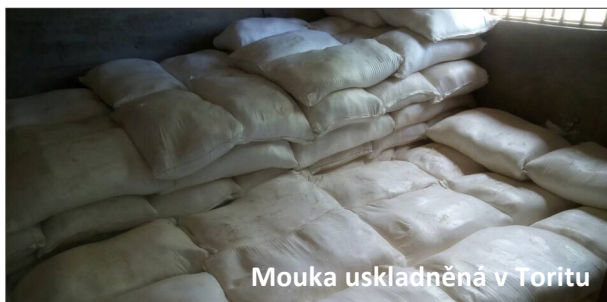
Mouka uskladněná v Toritu