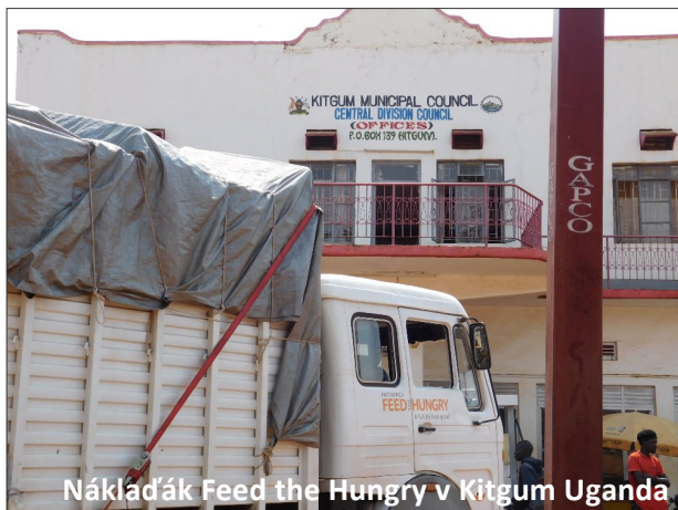
Nákladák Feed the Hungry v Kitgum Uganda