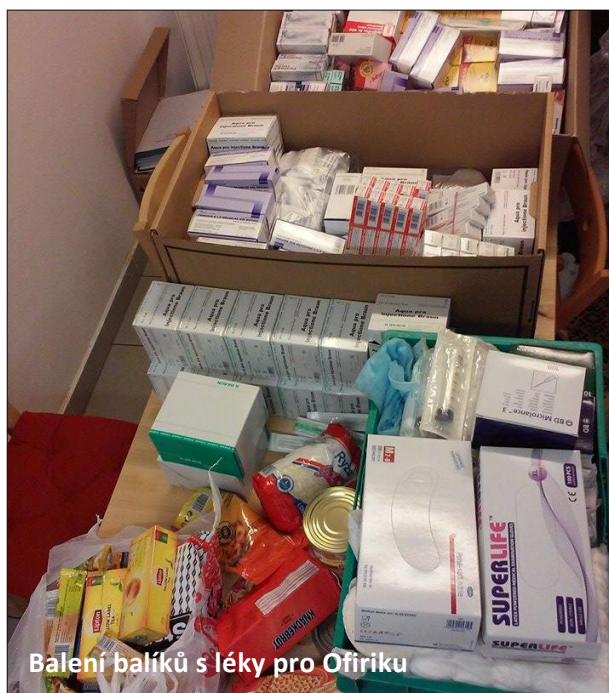
Balení balíků s léky pro Ofiriku