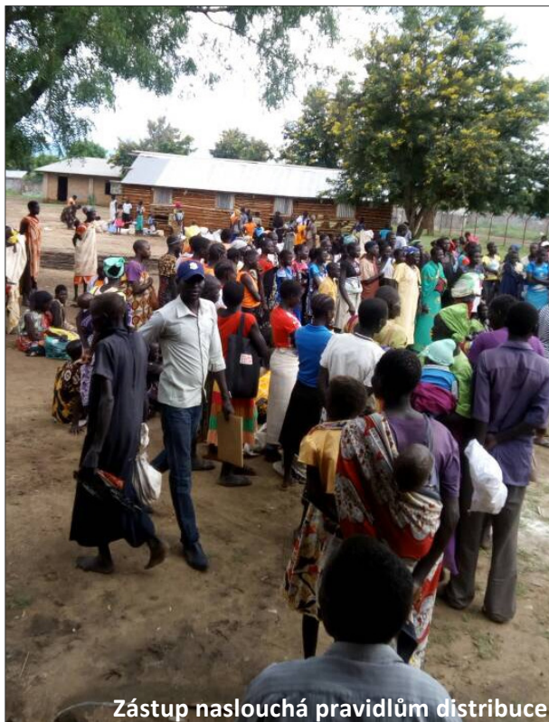
Zástup naslouchá pravidlům distribuce