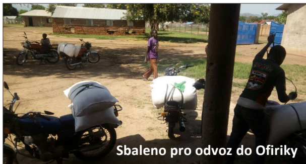
Sbaleno pro odvoz do Ofiriky