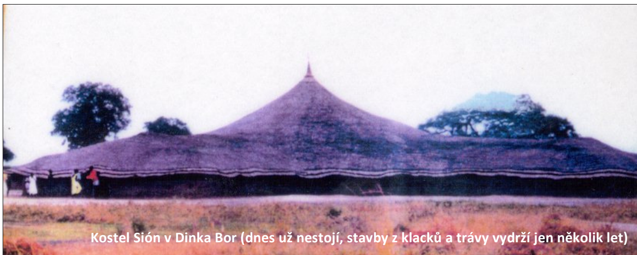
Kostel Sión v Dinka Bor (dnes už nestojí, stavby z klacků a trávy vydrží jen několik let)