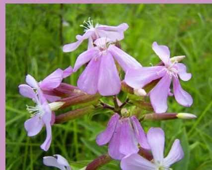
PŮVOD MÝDLA Mýdlíce lékařská ( Saponaria officinalis )

Mýdlo má však i svoje nevýhody, které se projeví, když to budeme s mytím rukou přehánět. Vysušuje a poněkud oslabuje kůži, takže se sice ubrání některým virům, zato se stane ještě zranitelnější pro jiné škodliviny. Speciální, takzvané antibakteriální mýdlo v tomto podle některých pokusů nadělá více škody než užítu. Představa, že se pomocí mýdla a dalších prostředků ubráníme všemu nebezpečnému, pak vede k posedlosti vnější čistotou, zatímco uvnitř zůstává nedůvěra ke Všemocnému Bohu. On nás provází veškerou nesnází a ochrání od toho nejhoršího.